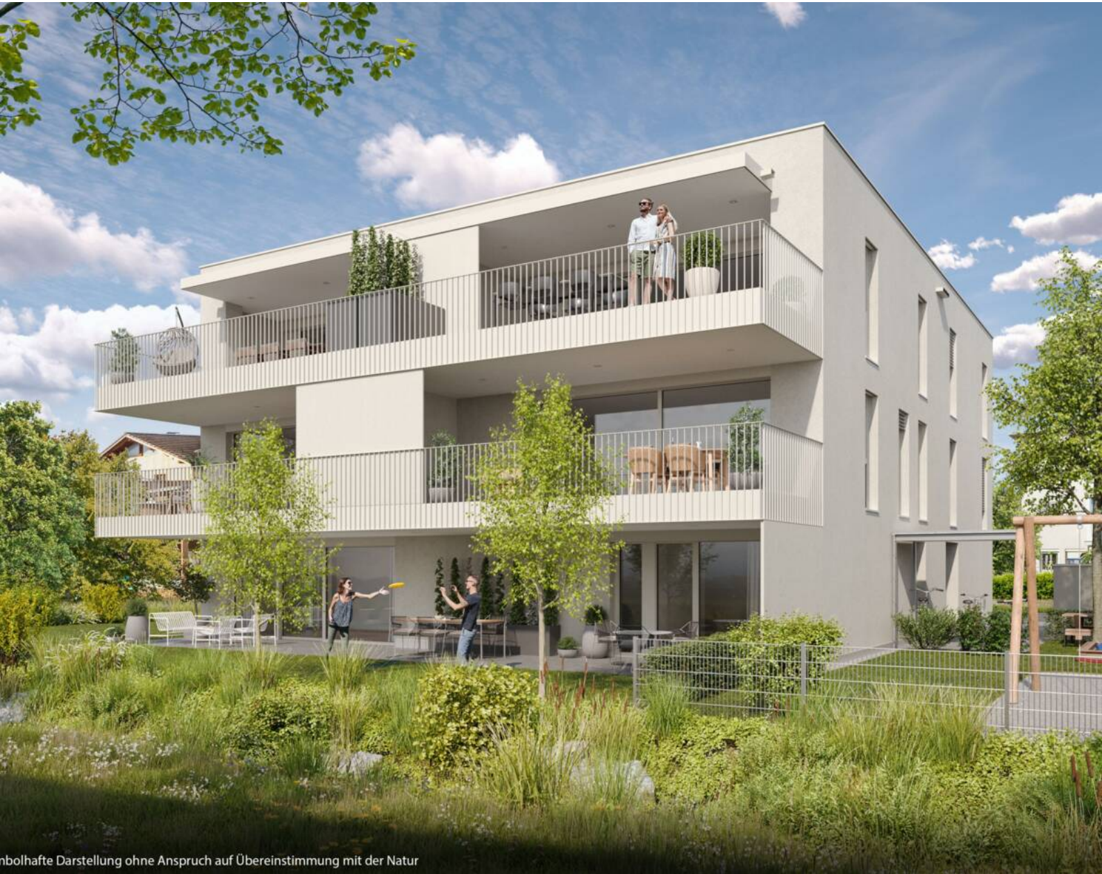
unvollständige Darstellung ohne Anspruch auf Übereinstimmung mit der Natur